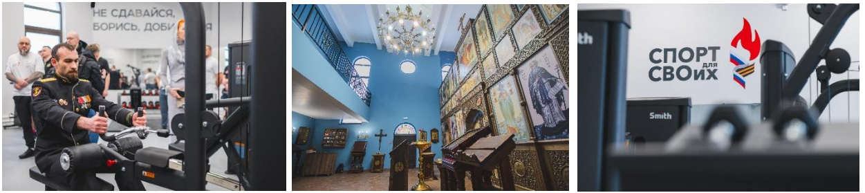
Фото по ссылке: https://disk.yandex.ru/d/tdgEyGCgyup0Aw